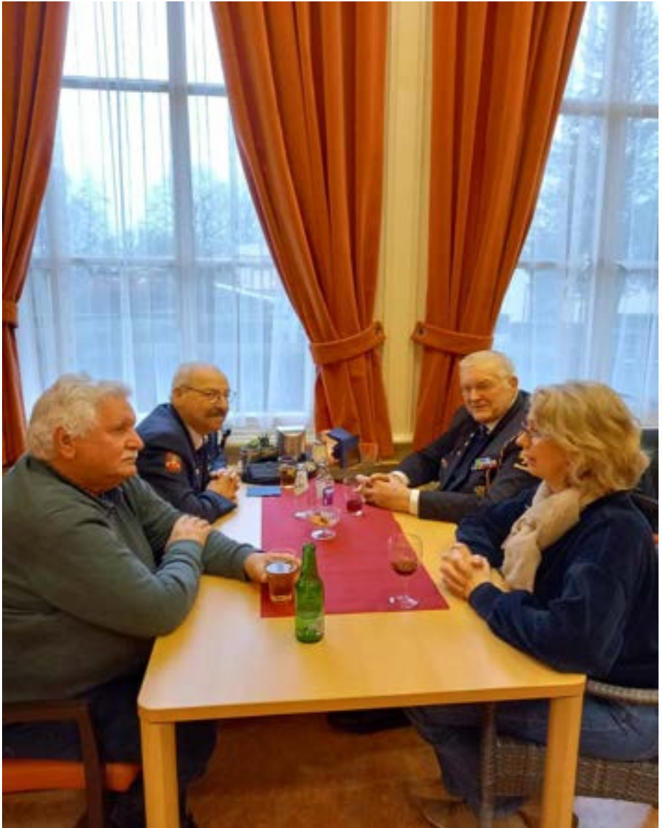
foto Veteranenborrel Bronbeek